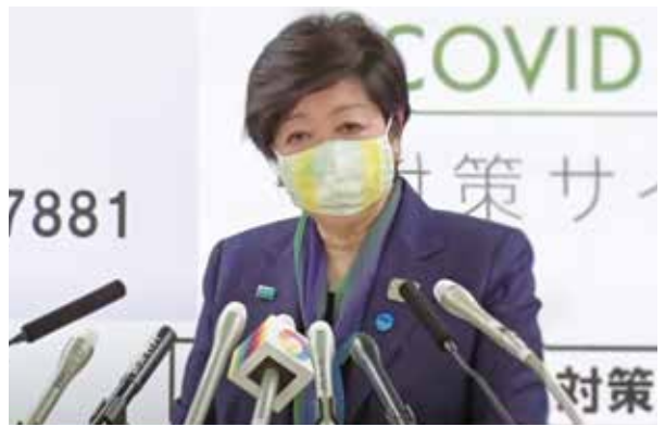
▲4月15日 記者会見にて新たな緊急対策を発表する小池知事

小池知事は4月15日の会見で、東京都独自の新型コロナウイルス対策の第4弾となる緊急対策を発表しました。